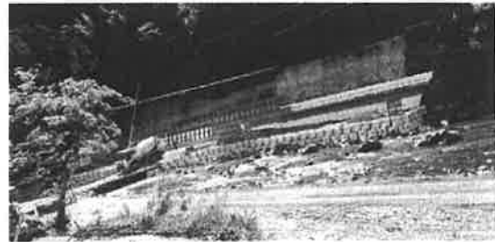
安芸川護岸の本格復旧工事