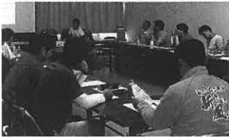
安芸新施設園芸システム研究会