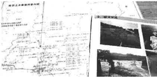
安芸市管内の災害復旧工事