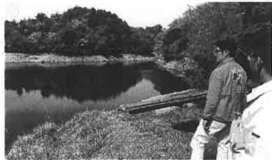
村内の農業用ため池の調査