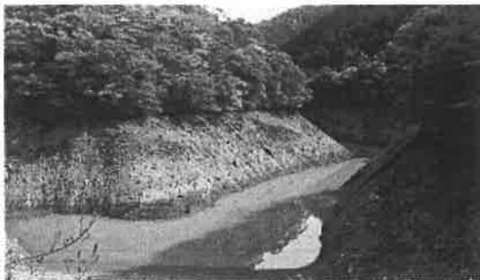
芸西村丸塚池の貯水状況