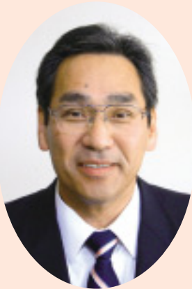
第91代副議長 中面 哲

このような時期に、正副議長の重責を担い、身の引き締まる思いがいたしております。このうちは、県民から負託を受けました議会の使命を果たすべく、これまで以上に県民の皆様の声を反映した議会活動に取り組むとともに、行政のチェック機能や政策提言機能の更なる強化に努め、県民福祉の向上と県勢発展のために、全力を尽くしてまいりますので、県民の皆様の一層のご指導、ご支援をお願い申し上げます。