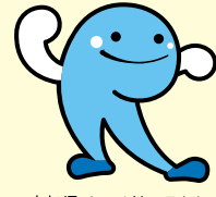
高知県イメージキャラクター「くろしおくん」