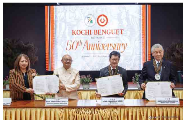
50周年を記念する共同声明に調印

滞在中は、50年前に締結された協定の再宣言や、交流を記念して開設された「さくらパーク」に新たな桜の苗木を植樹するなど、両県州のより豊かな関係構築に向け絆を深めました。