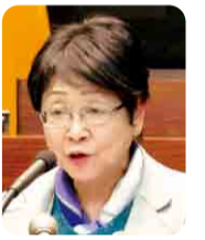
参与(官民連携推進監)の任用