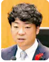
横山 文人 (自由民主党)