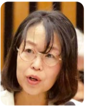
はた 愛 (日本共産党)

より多くの中学生が乳幼児と触れ合い、生命の貴さや自らの成長を実感し、将来の子育てを具体的に思い描けるよう、取組の充実を図っていく。