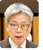
岡田 芳秀 (日本共産党)

観光部局と連携し、どぶろ高知旅キャンペーンで造成された観光コンテンツをクルーズ船社に紹介するモニターツアーなどを実施している。引き続き、関係部局と緊密に連携して、誘致に取り組む。