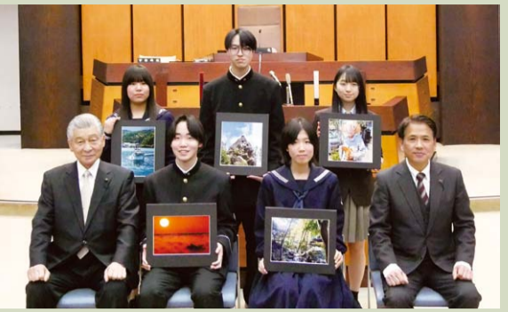
昨年度入賞者のみなさん

高校生等の皆さんに議会や政治への関心を深めていただくきっかけづくりに、フォトコンテストを実施します。若い方々が感じる「高知の魅力」が詰まった作品をお待ちしております。 入賞作品は、こうち県議会だよりやホームページへの掲載など、県議会の広報活動に使用させていただきます。また、入賞者には副賞として図書カードを進呈します。