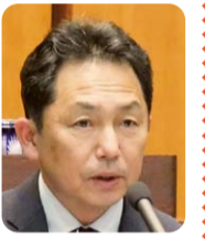
細木 良 (日本共産党)