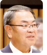
土森 正一 (自由民主党)