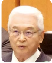
明神 健夫 (自由民主党)

答 知事 公務員の休暇制度は令和8年4月に県内全都市町村で導入が完了する見込みである一方、民間企業での導入は全国的に進捗が芳しくない。不妊治療特有の事情について職場で十分に理解されていないため、プライバシーの配慮を含めた環境づくりの周知啓発が重要と考える。