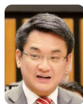
西内 隆純 (自由民主党)

所得向上総合補助金ではリカレント教育などによる人材育成も支援対象としており、幅広い活用を働きかけていく。